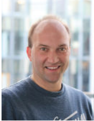
Chefredakteur: Marco Theimer -150