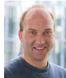
Chefredakteur: Marco Theimer -150