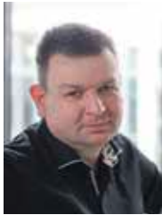
Chefredakteur: Christian Blümel -185