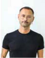
Chefredakteur: Michael Teodorescu -175