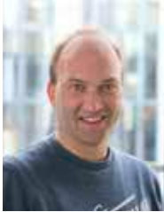
Chefredakteur: Marco Theimer -150